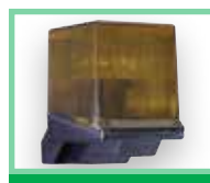
Majáky viz Příslušenství