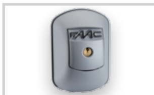
Klíčový spínač XK21 L (24 V) s odblokovacím mechanismem (externí odblokovací kit)