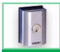
Klíčové spínače viz Příslušenství