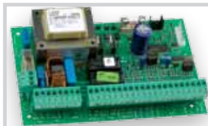
Řídicí jednotka 462 DF (nutný Digiprogram) viz Příslušenství