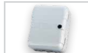
Box na řídicí jednotku mod. L