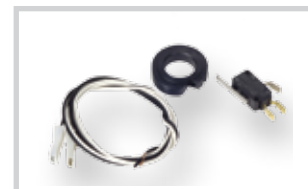
Koncový spínač kit (pro otevření a zavření)**