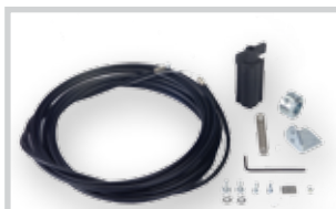
Externí uvolňovací zařízení s kabelem a bovdenem* a délkou 5 m