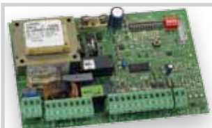
Řídicí jednotka 452 MPS viz Příslušenství