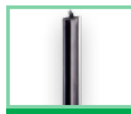
Bezpečnostní zařízení viz Příslušenství