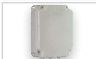
Box na řídicí jednotku mod. E