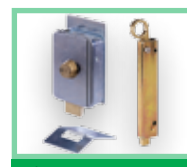
Různé příslušenství viz Příslušenství