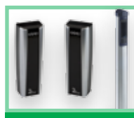
Fotobuňky a sloupky viz Příslušenství