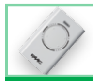
Ovladače viz Příslušenství