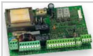
Řídicí jednotka 455 D viz Příslušenství