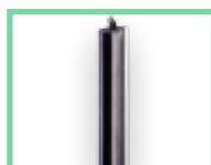
Bezpečnostní zařízení viz Příslušenství