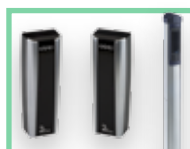
Fotobuňky a sloupky viz Příslušenství