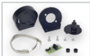
Enkodér pro 740 D*