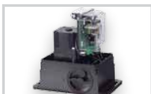
Zabudovaná řídicí jednotka 740 D viz Příslušenství