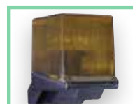
Majáky viz Příslušenství