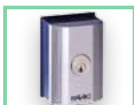
Klíčové spínače viz Příslušenství