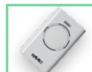
Ovladače viz Příslušenství