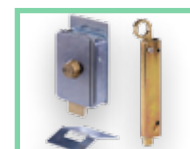
Různé příslušenství viz Příslušenství