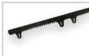
Plastový hřeben s ocelovým jádrem a příslušenstvím pro max. váhu brány 400 kg (bal. po 4 m)