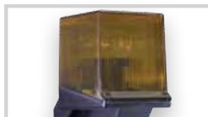
FAAC maják 24 V