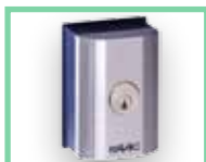
Klíčové spínače viz Příslušenství