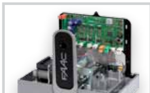
Řídicí jednotka E 720 viz Příslušenství