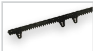
Plastový hřeben s ocelovým jádnem a příslušenstvím pro max. váhu brány 400 kg (bal. po 4 m)