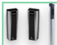
Fotobuňky a sloupky viz Příslušenství