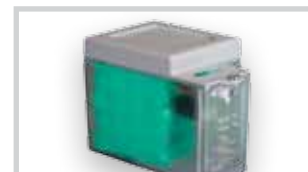
Záložní bateriový kit XBAT 24 (nelze pro E 124)