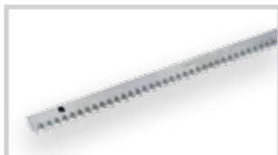
Galvanizovaný hřeben 30 × 12 mod. 4 s příslušenstvím (balení po 4 m)