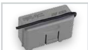
Přijímač XF 433 Mhz Přijímač XF 868 Mhz