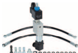
uvolňovací sada s tlakovým spínačem pro sloup J200 HA