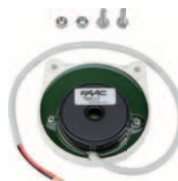
akustická signalizace pro sloup J200 HA