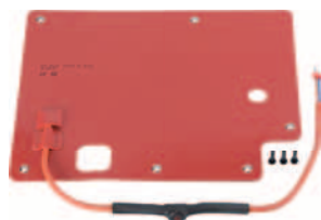
vyhřívání sloupu J200 HA