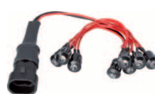
sada LED osvětlení pro sloup J200 HA