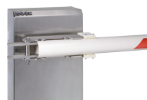
Držák vyrážecího kulatého ráhna (nerezová ocel)